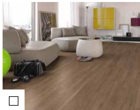
DUB Brown Charlotte