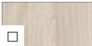
DUB SALINAS ECO top