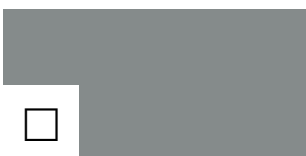
TITANO UNI mat plus