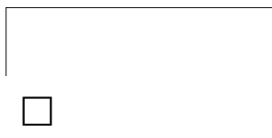
BIELA UNI mat plus

(vyberte si jeden variant zaškrtnutím políčka)